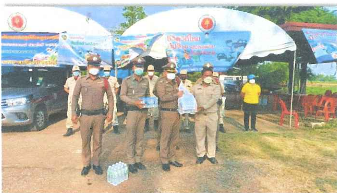
วันที่ ๑๖ เม.ย.๖๕ เวลา ๑๖.๓๐ น. พล.ต.ต.นิพนธ์ พานิชเจริญ ผบก.ภ.จว. เพชรบูรณ์ ตรวจเยี่ยมและมอบสิ่งของเยี่ยมจุดตรวจ ณ จุดบริการประชาชนแยกศาลสมเด็จพระนเรศวร ตำบลท่าไร่ อำเภอวิเชียรบุรี