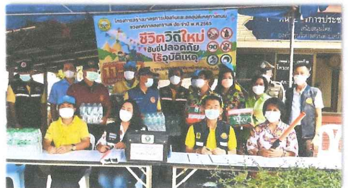
อำเภอเมืองเพชรบูรณ์