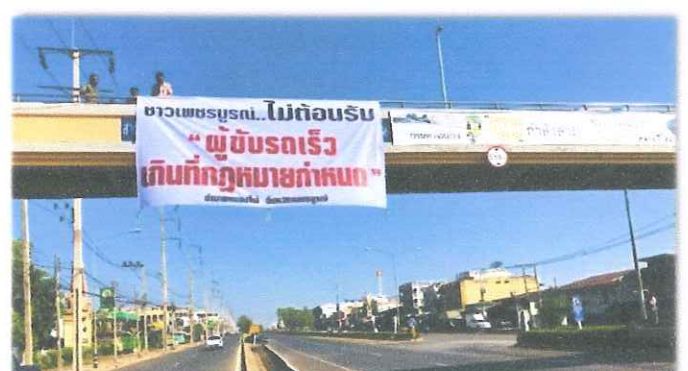
อำเภอหนองไผ่