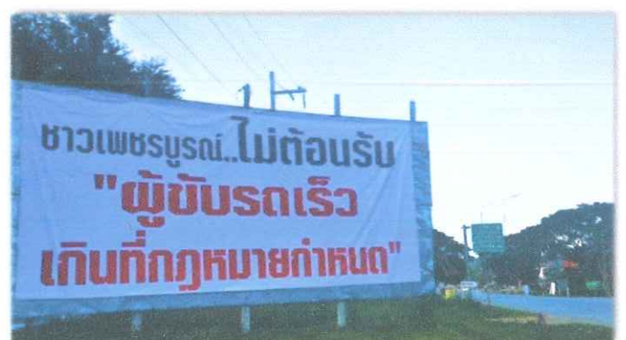
อำเภอศรีเทพ