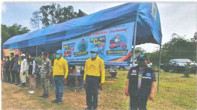
อำเภอเขาค้อ

ศูนย์อำนวยการความปลอดภัยทางถนนจังหวัดเพชรบูรณ์กำหนดให้ศูนย์ปฏิบัติการความปลอดภัยทางถนน อำเภอจัดทำป้ายประชาสัมพันธ์ “จังหวัดเพชรบูรณ์ไม่ต้อนรับผู้ขับขี่รถเร็วเกินกว่าที่กฎหมายกำหนด” และป้ายรณรงค์ “ชีวิตวิถีใหม่ ขับขี่อย่างปลอดภัย ไร้อุบัติเหตุ” โดยให้ติดตั้งบริเวณถนนสายหลัก หรือ จุดที่มีการจราจรหนาแน่นในช่วงเทศกาลสงกรานต์ พ.ศ.๒๕๖๕ ในพื้นที่รับผิดชอบของอำเภอนั้นๆ