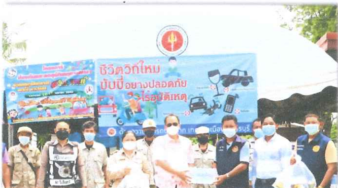
อำเภอวิเชียรบุรี