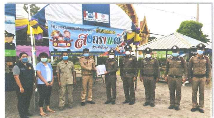
วันที่ ๑๖ เม.ย.๖๕ เวลา ๑๗.๐๐ น. พล.ต.ต.นิพนธ์ พานิชเจริญ ผบก.ภ.จว. เพชรบูรณ์ ตรวจเยี่ยมและมอบสิ่งของเยี่ยมจุดตรวจ ณ จุดบริการประชาชนตำบลพยุขาม อำเภอศรีเทพ