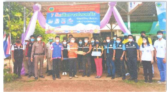
วันที่ ๑๔ เมษายน ๒๕๖๕ เวลา ๐๙.๓๐ น. นายอำนาจ แยมศิริ รองผู้ว่าราชการจังหวัดเพชรบูรณ์ ตรวจเยี่ยมและมอบสิ่งของเยี่ยมจุดตรวจ ณ หน้าองค์การบริหารส่วนตำบลเพชรละคร อำเภอหนองไผ่