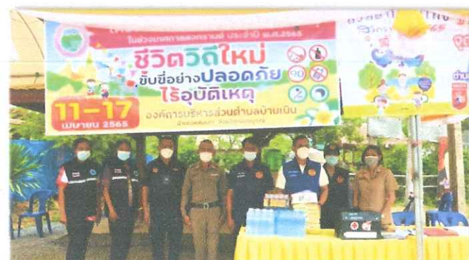
อำเภอหล่มเก่า